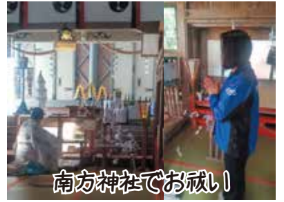
南方神社でお祓い

2月28日に、勝福フェアに来店して頂いた時、ひいたおみくじを結んでくれた木のお祓いをしてもらう為、南方神社に行ってきました。神主さんが、4年前にも同じように木のお祓いをして頂いた事を覚えてくれていて、皆さんの健康と今年が良い年になりますようにと祈願して、おみやげに今年の千支のうさぎの根付と千菓子のご飴を頂いてきました。南方神社でも、このような木のお祓いをするのは、珍しいとの事です。（中村千加代）