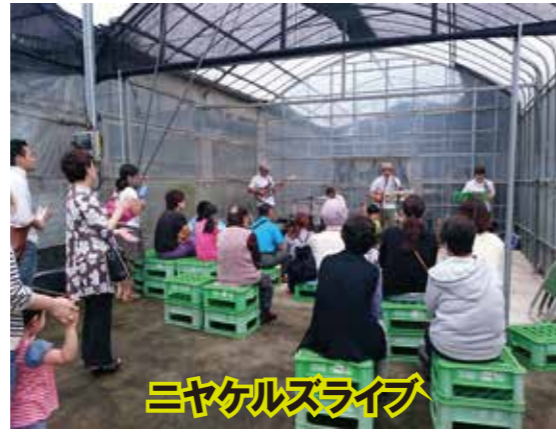
ニヤケルズライブ