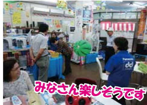
みなさん楽しそうです