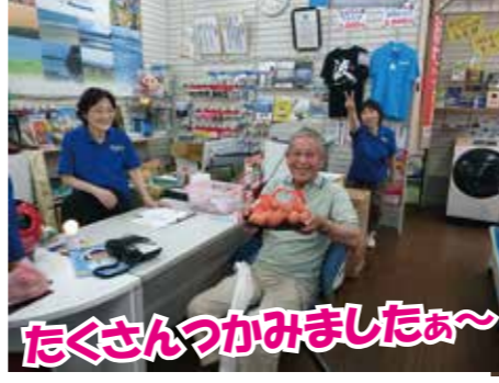
たくさんつかみましたあ〜