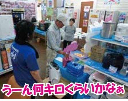
うーん何キロくらいかなあ